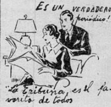
ES UN VERDADERO hobby!